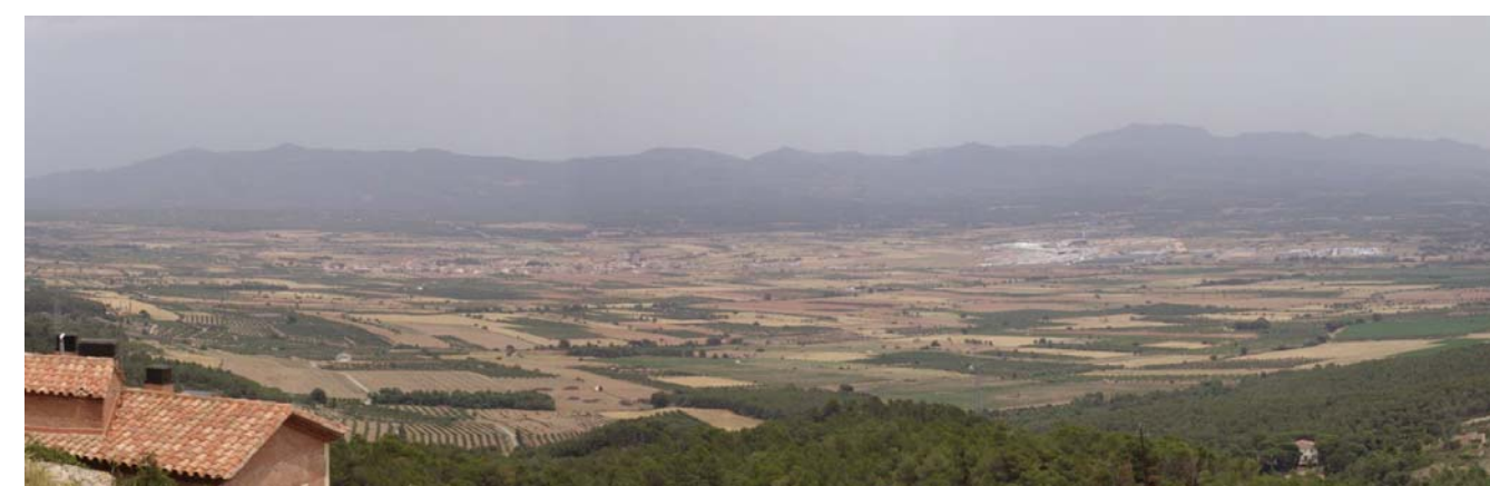
Figura 22.1. Panoràmica de la Plana de l'Alt Camp des de la serra de Miramar. Destaca enmig de la gran superfície de conreu el polígon industrial del Pla de Santa Maria.