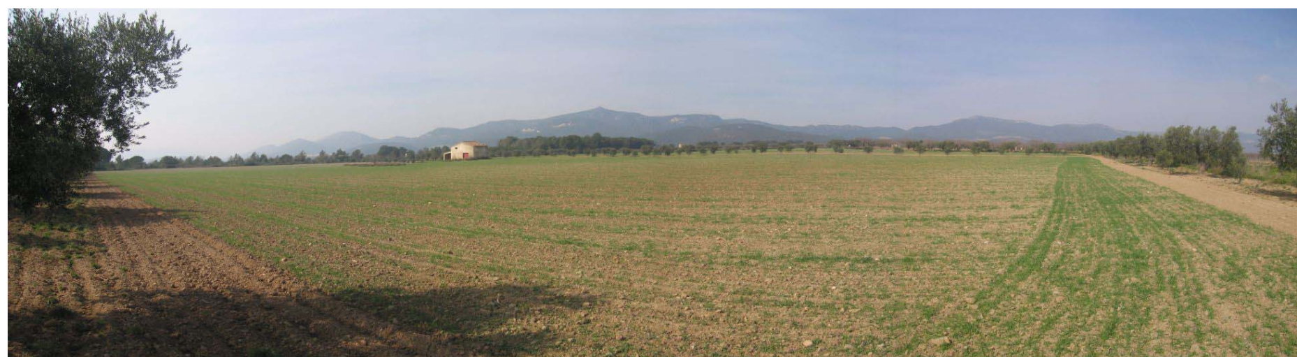
Figura 22.5. Al sector nord de la Plana de l'Alt Camp hi predomina el conreu dels cereals d'hivern. Les parcel·les sovint estan delimitades per files d'oliveres.

En l'actualitat escriptors com Joan Barril o fotògrafs com Toni Vila estan deixant registre escrit, fotogràfic i pictòric dels paisatges de la zona, testimonis d'un present que ens expliquen molt del passat i que ens fixen la imatge que hauria de perdurar en el futur.